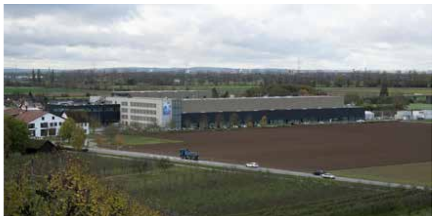
Das Weltunternehmen Schott will an seinem Standort in Hügelheim nochmals auf der Nordseite des bestehenden Neubaus etwa um die gleiche Dimension erweitern.

„Für dieses Bauvorhaben müssen als Ausgleich für die Versiegelung der Natur etwa 250.000 Ökopunkte eingesetzt werden“, erklärte die Baudezernentin. Das bedeutet: Die erforderlichen Ausgleichsmaßnahmen müssen an anderer Stelle, aber möglichst auf Hügelheimer Gemarkung, umgesetzt werden. Übrigens: Die Kosten für den neuen Bebauungsplan wird Schott übernehmen, kündigte Bürgermeister Martin Löffler an. Das Projekt wird nicht nur vom Gemeinderat, sondern auch vom Ortschaftsratsrat Hügelheim positiv bewertet. Deshalb folgte der Gemeinderat dem Beschlussvorschlag der Stadtverwaltung, die frühzeitige Beteiligung der Träger öffentlicher Belange durchzuführen.