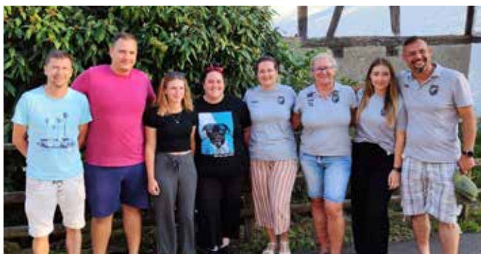
Das Bild zeigt die neue Vorstandschaft, es fehlt die Beisitzerin G Jugend Shipqe.

Eure Jugendvorstandschaft des SV Weilertal 1926 e.V.