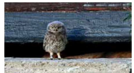
Frisch beringter Steinkauz

Im Rahmen des Streuobstwiesen-Projekts zur Erhaltung und Förderung der Artenvielfalt ist das aber ein Erfolg, der dem Engagement einer erfreulich großen Zahl von ehrenamtlichen Betreuern sowie der Zusammenarbeit mit den zuständigen Landbesitzern/Landwirten zu verdanken ist. An dieser Stelle sei auch der Gemeindeverwaltung gedankt, die bei der Zusammenarbeit wertvolle Unterstützung leistet.