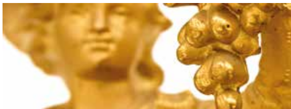
Glanzstücke und Grundsteine