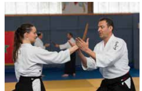
Verteidigung gegen Messerangriff

Weitere Informationen, auch zu den Trainingszeiten auf www.tammazla.de