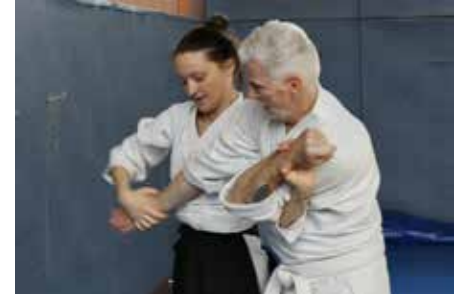
Armstreckhebel über die Schulter

Informationen und Anmeldung unter tammazla@gmx.de oder unter: 017684886947.