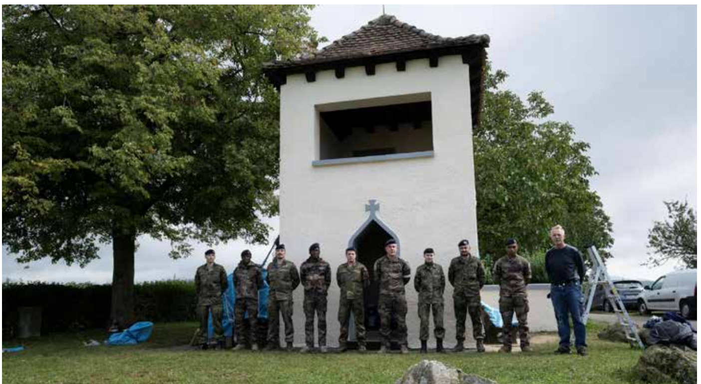
Bild des „Staatsbürgers in Uniform“, der sich für die Zivilgesellschaft engagiert, vermittelt werden. Das Versorgungsbataillon ist Teil der Deutsch-Französischen Brigade in Müllheim. „Das Ziel ist, dass sich die Soldatinnen und Soldaten im Einsatz auch mit den Werten der Gesellschaft identifizieren können“, erklärte einer der Führungskräfte. Es gibt auch eine Botschaft an die Bürgerinnen und Bürger: „Die Zivilbevölkerung soll erfahren, dass sie sich auf ihre Soldatinnen und Soldaten verlassen kann.“

Seit 2022 gibt es den „Tag der Werte“. Das deutsche Heer hatte diese Aktion ins Leben gerufen, um einerseits die persönliche Entwicklung der Soldaten zu fördern. Zusätzlich soll der Zivilbevölkerung vor Ort das