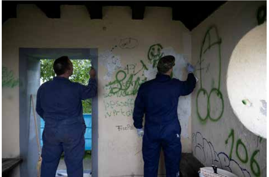
Die Stabskompanie des Versorgungsbataillons der Deutsch-Französischen Brigade nahm sich am diesjährigen Tag der Werte die Schmierereien am Jägerdenkmal im Gewann Luginsland vor.