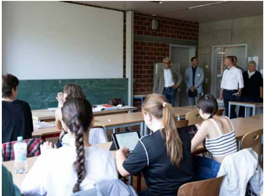
Landrat Dr. Ante war vom Umgang mit der neuen Technik in den Unterrichtssituationen beeindruckt.

Sorge bereitet den Müllheimer Stadträten und auch den Kreisräten die Zukunft der