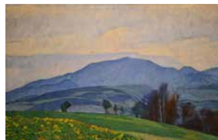
Hermann Daur "Der Blauen"

Die Führungsgebühr inkl. Eintritt beträgt 5 €, reduziert für Museumsvereinsmitglieder und Inhaber des Museumspasses 2,50 €.