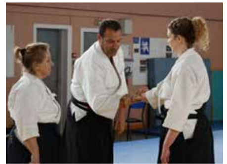
Handgelenkhebel mit einem Kugelschreiber

Weitere Informationen, auch zu den Trainingszeiten auf www.tammazla.de