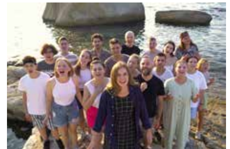
Das Ensemble vom "Musik für den Frieden" beim letztjährigen Friedens-Camp

Dieses Camp zeigt: Gerade in Zeiten politischer Spannungen und Unsicherheiten können junge Menschen durch Musik, Dialog und gemeinsame Erlebnisse Brücken bauen – ein kleiner, aber bedeutender Schritt in Richtung einer friedlicheren Welt.