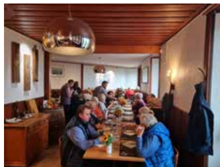
In der Auberge du Vigneron

Leider hatte der Wettergott es nicht gut mit uns gemeint, denn just an diesem Tag kam der große Regen und das den ganzen Tag. Aber bis auf wenige, nahmen alle an der Fahrt teil und haben es nicht bereut. Das Programm mussten wir wegen des Dauerregens ändern und besuchten zuerst in Vevey das Museum Jenisch. Dort ist derzeit eine interessante Ausstellung/Biennale 2024 von verschiedenen Künstlern zu vielen Themen. Danach fuhren wir mit unserem Bus zu einer Auberge in den Weinbergen. Hier wurden wir mit einem wunderbaren 3-Gang-Menü und gutem Wein für das schlechte Wetter belohnt. So waren alle der Meinung, dass die Fahrt nach Vevey sich gelohnt hat, auch wenn wir die geplante Fahrt mit dem Panoramazug durch die Weinberge nicht machen konnten.