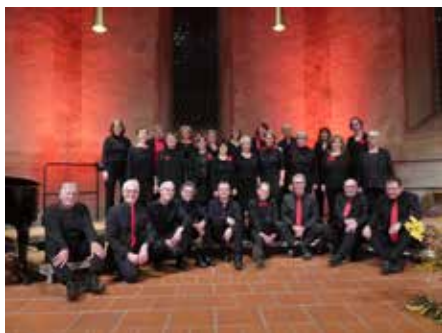
Der Chor Temporal e.V. aus Müllheim

Sonntag, den 17.11.2024 - 17.00 Uhr / St. Peter und Paul Kirche Bamlach Das Konzert in der kath. Kirche in Bamlach findet auf Spendenbasis statt.