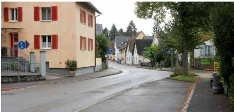
Die umfangreiche Sanierung der Vögisheimer Ortsdurchfahrt wird sich über einen Zeitraum von zwei einhalb Jahren erstrecken.

Allein in Vögisheim misst die Strecke der Ortsdurchfahrt rund 750 Meter. Dort wird der komplette Straßenraum aufgerissen, weil sämtliche Leitungen und Kanäle erneuert werden müssen. Der Umfang der Arbeiten in der Verantwortung der Stadt umfasst die Kanalisation inklusiver aller Hausanschlüsse, eine neue Brunnenleitung, die Erneuerung der Ortsbeleuchtung, das Verlegen der Breitbandleitungen samt der sogenannten „Backbone-Leitung“ des Zweckverbandes des Landkreises und die Maßnahmen für den Hochwasserschutz. Die Stadtwerke Müllheim/Staufen werden neue Trinkwasserleitungen samt Hausanschlüssen verlegen, neue Leitungen für die Stromversorgung ziehen und eine neue Gasleitung verlegen. Alleine die Kosten für die Stadt, Planungsstand aus dem Jahr 2023, belaufen sich in einer Größenordnung von etwa 2 Millionen Euro für die Verkehrsanlage, etwa 3,5 Millionen für die Kanalisation, 600.000 Euro für die Ortsbeleuchtung und 250.000 Euro für die Brunnenleitung. Weil die Planungen für das Breitband und für den Hochwasserschutz noch nicht vorliegen, könnten da noch keine Kostengrößen benannt werden. Die Stadtwerke investieren nach bisherigen Schätzungen etwa 2,5 Millionen Euro in die Wasserversorgung, Stromversorgung und in die Gasversorgung.