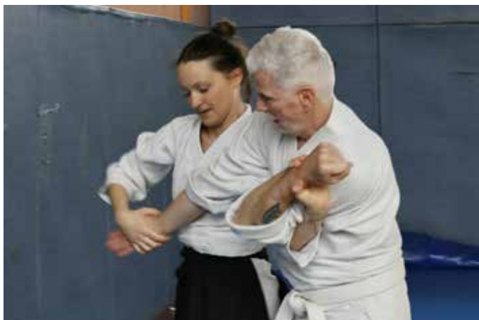
Armstreckhebel über die Schulter

Hier lernen Sie Selbstverteidigung, vorbeugende Maßnahmen in Gefahrensituationen, Deeskalation und Mut zur Zivilcourage. Informationen und Anmeldung unter tammazla@gmx.de oder unter 017684886947.