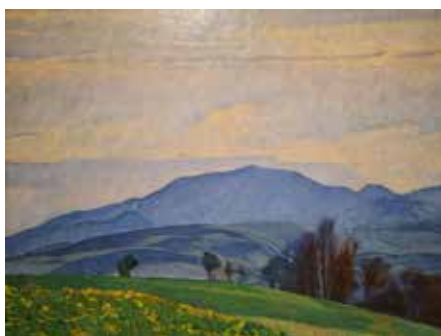
Hermann Daur „Der Blauen“

Öffentliche Führung am Sonntag, 20.10.2024, 11.15 Uhr