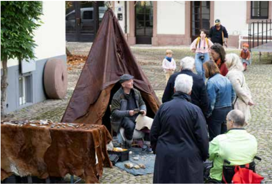
Ein Tag voller historischer Entdeckungen für Groß und Klein.