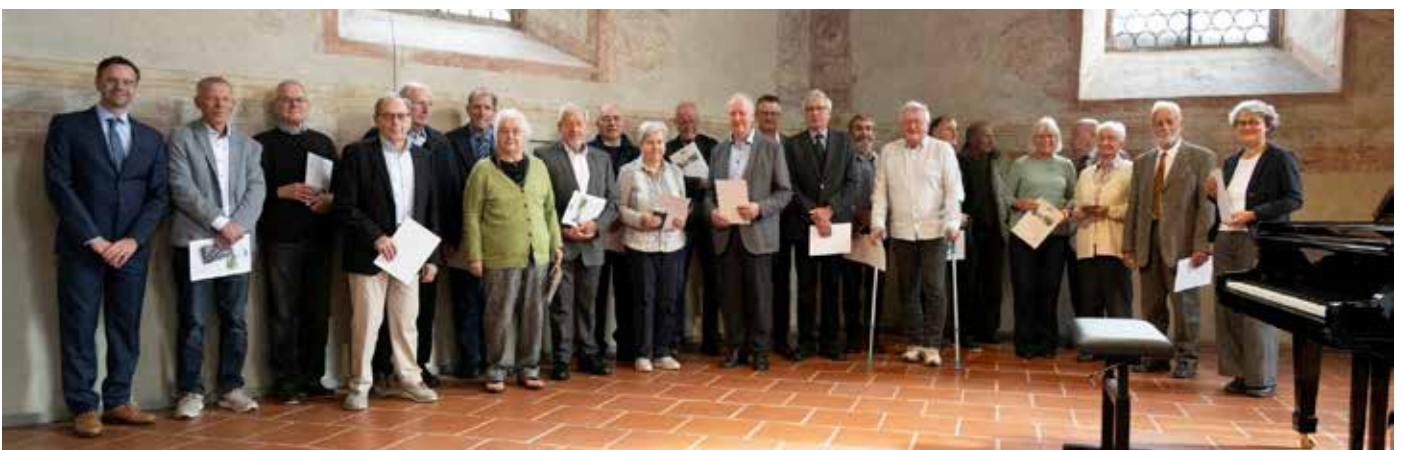
Beim Festakt zum 50. Geburtstag von Markgräfler Museum und Museumsvereins wurden zahlreiche langjährige und verdiente Mitglieder geehrt.